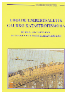
Uholde unibertsaletik gaurko katastrofismora Juan Ignazio Abrisketa Joseba Etxeberria GAIK

7-10 urte bitartekoentzako antzezlan bat da. Duela 500 urteko Txinan Txiukue izeneko 20 urteko neska bat bizi da. Herriko alkatearen alaba da, eta Peifen-ekin gustatuta dago: etxeko neskamea den bere adineko neskato langilearekin. Aitak alaba ezkondu nahi du, eta lau senargai aukeratu ditu. Txiukuek, ordea, Peifenekin ezkondu nahi du. •