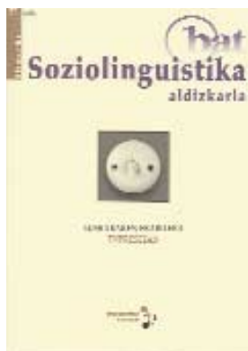
BAT Soziolinguistika adizkaria 59. alea

12 urtetik aurrerakoei zuzenduta dago. Matteomiglia herri zelebrea da, idazle irudimentsu batek sortutakoa. Herriko postontzi guztietatik itsasoa hasi da irteten eta komediak izango ditu postariak. Bestalde, ez da oso ohikoa udaletxeko funtzionario poeta bat aurkitzea ere. Eta Gilberto ehiztari mutilzaharra? Egia ote Parisko Marguerite panpoxak maitasun gutun bat bidali ziola? •