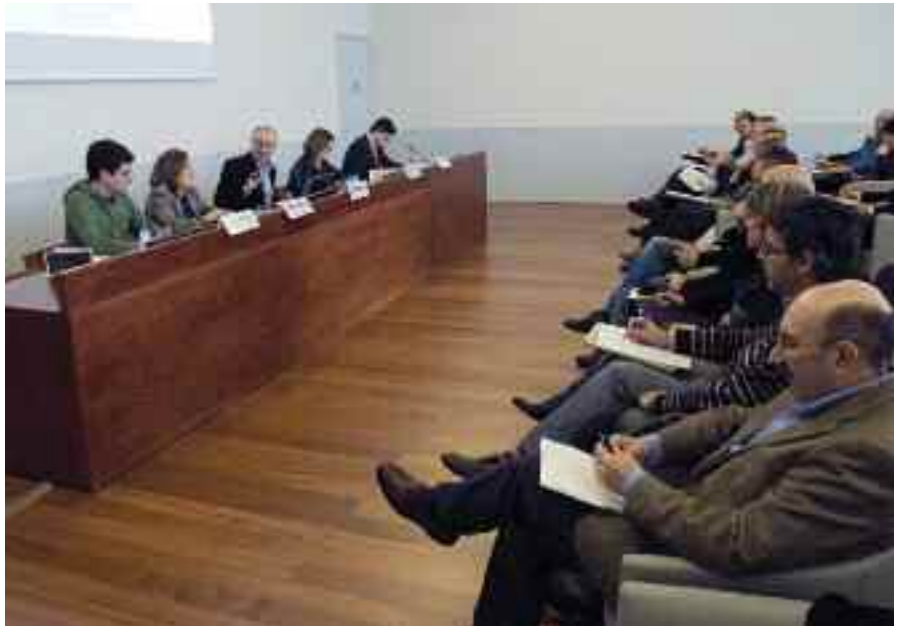
Ikastolen Elkartearen jardunaldietan aurkeztu zuten adierazpena.

LOMCE eta Falloux legeei aurre egin beharrean gaude, gure hezkuntza-sistemari zuzenean erasotzen dioten bi mehatxu handi baitira. Euskarazko testuliburuaren sorgin-ehiza abiatu duen Nafarroako Gobernuarenekin ere hor dugu; eta baita Euskararen Legean iraga-