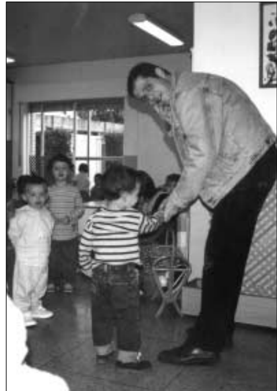
Iruñeko Egunsenti Haur Eskolako ikasle eta gurasoak.

Prozesu hau haur berriein, zaharrek eta beste eskoletatik etorritakoekin egiten dute, guztiekin. "Kontuan izan behar da zaharrentzat ere uda tartean egon dela eta hilabete eta erdi horretan familiarekin egon direla denbora guztian" dio Ajonak. "Gainera, zaharrak ere gelaz aldatu egiten dira