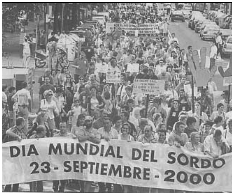
Irailaren 23an Bilbon egin zen manifestaldia.