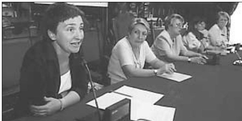
Gipuzkoako Foru Aldundian egindako aurkezpen ofiziala.