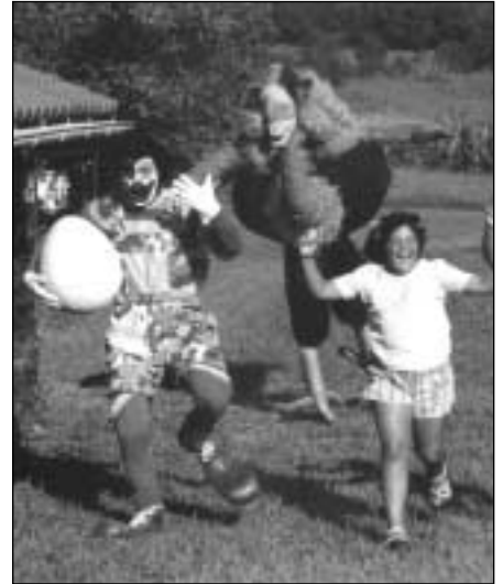
Hernaniko Zelai-gain baserrian burutu da errodajea, nahiz eta kasu batzuetan beste lekutara ere mugitu.