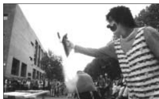
Donostiako Irakasle Eskolan Topaketan dokumentazioaren banaketa eta sarrera ekitaldia burutzen ari zireneko irudi batzuk.