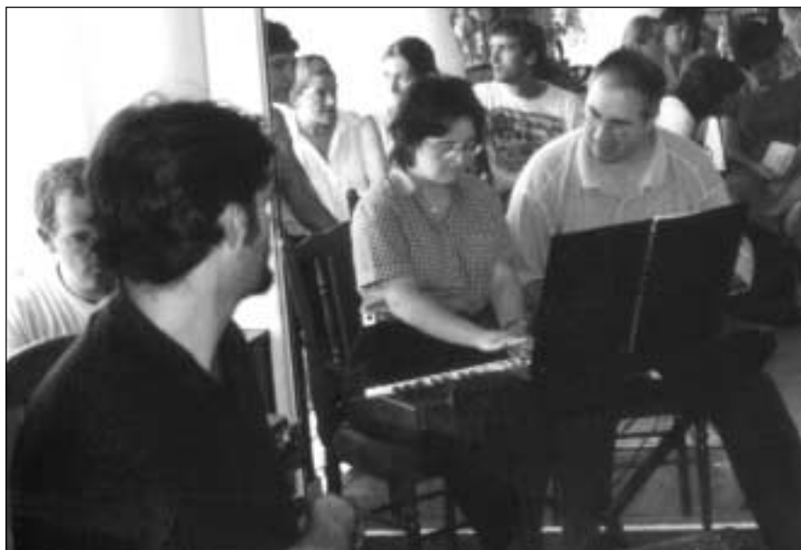
Tenis klubean egin zen Topaketei amaiera emateko bazkari-festa.