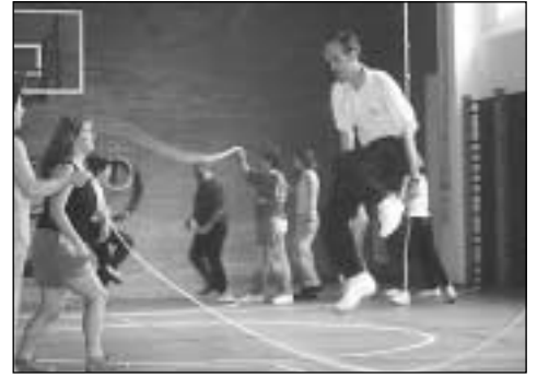
Topaketetan hartutako irudietan hainbat hizlari eta parte-hartzaile agertzen da.